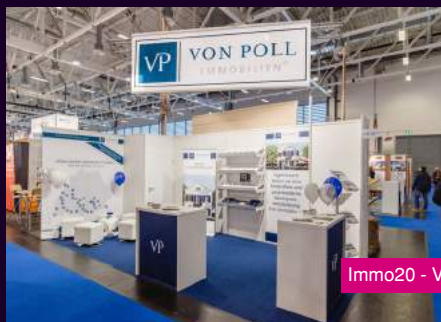
Immo20 - Von Poll Immobilien