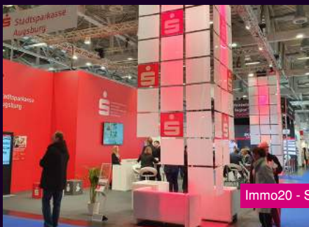
Immo20 - Stadtsparkasse Augsburg