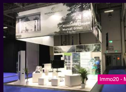
Immo20 - Mursall Group